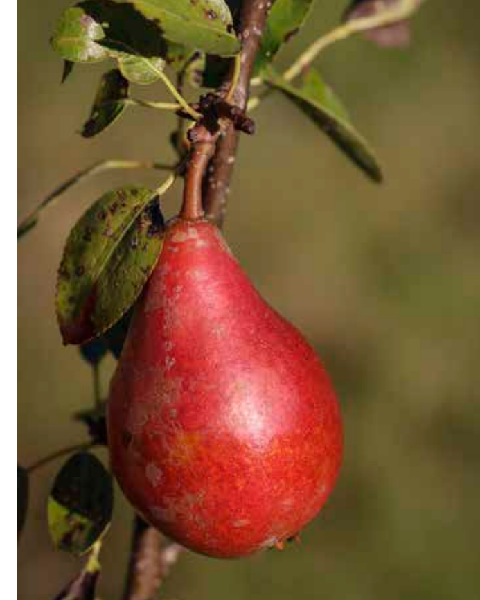
Frugtræerne består overvejende af æbler. Men der blev også plantet 68 pæresorter samt enkelte kirsebær, moreller, blommer og paradisæbler fra Bent Nielsens samling.

Mosegrise nåede i 2021 at gnave rødderne af en håndfuld frugtræer, så der kun var stamme og grene tilbage. Det er en udfordring at kontrollere mosegrise, men der blev opsat klappælder rundt omkring i haven, der sammen med rovfuglenes indsats begrænsede bestanden.