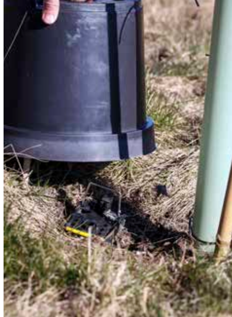
Klapfælder sat under sorte potter tæt på de små træer for at bekæmpe gnavere.