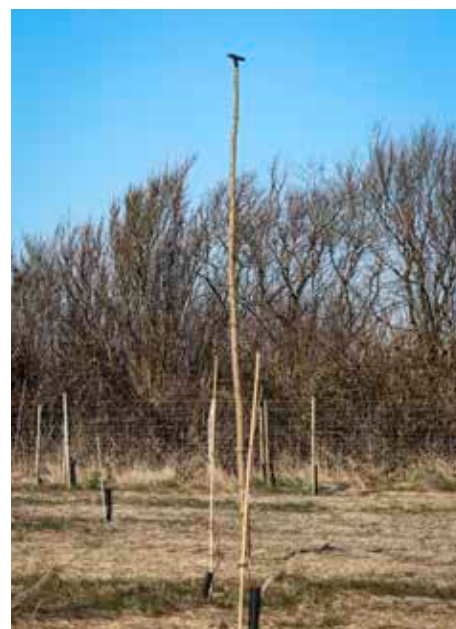
Mellem de små træer rager høje sidde-møler op, hvorfra tårnfalke og musvåger overvåger musene.