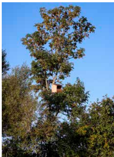
Rovfugle lokkes til med falke- og uglekasser i håbet om, at de vil fange nogle gnavere.