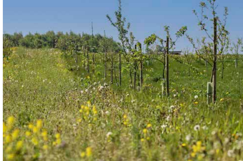
For at opveje den tabte biodiversitet ved at holde græsset kort omkring selve træerne sås bræmmer med blandinger af vilde blomster. Planterne slås kun et par gange om året.