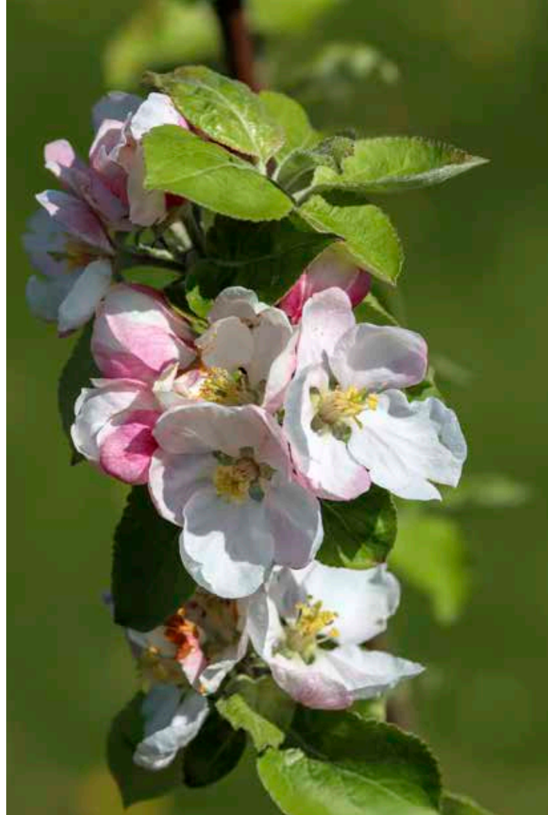
Tåsinge har et mildt kystklima, der gør den ideel til frugtavl. Vandet omkring øen holder på varmen, så der kun sjældent kommer så streng nattefrost, at det ødelægger blomstringen og frugtsætningen.

Derefter skulle havens design planlægges, Svendborg Kommune skulle godkende en lokalplan for den kommende besøghave, marken skulle omlægges til en økologisk drevet