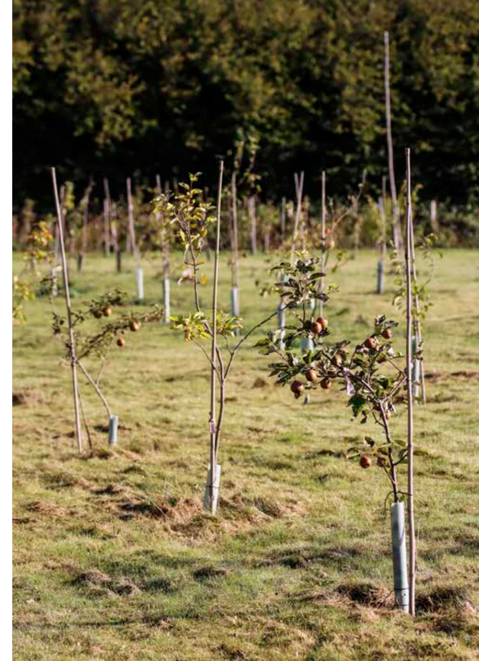
I de første år er der ikke mange frugter at hente fra træerne. Men om et par år forventes det, at høsten begynder at blive så stor, at æblerne kan anvendes til forskellige arrangementer og prøvesmagninger af nye og gamle frugtsorter.

Hvor hurtigt idéerne realiseres afhænger af de frivilliges ressourcer både økonomisk og tidsmæssigt. Som mange andre foreninger rundt om i landet, kan det være en udfordring at skaffe nok hænder til både det praktiske arbejde og udviklingsarbejdet.