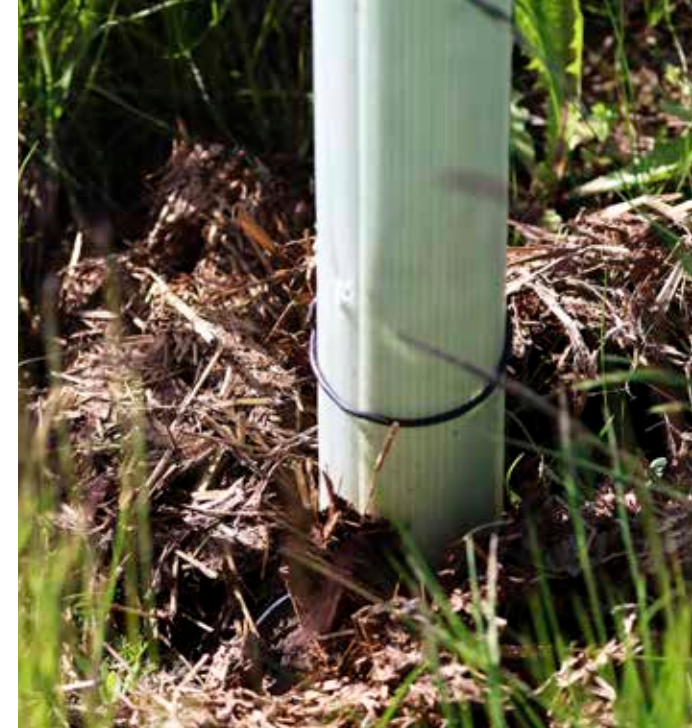
Plastkrørene skal beskytte de unge træers stammer mod gnaverbid. Rundt om træerne er der i 2022 gødet med komøg fra en lokal økolog.

Nu hvor besøghaven har nogle år på bagen, og de ydre rammer er på plads, mødes de frivillige ildsjæle hver onsdag i to timer, hvor de arbejder på at vedligeholde og udvikle haven. Alt efter årstiden handler de praktiske driftsopgaver om at luge jorden rundt om frugtræerne, beskære, rette opbindinger, samle sten, bekæmpe skadedyr, plante nye træer, så vilde blomsterfrø, slå græsset mv.