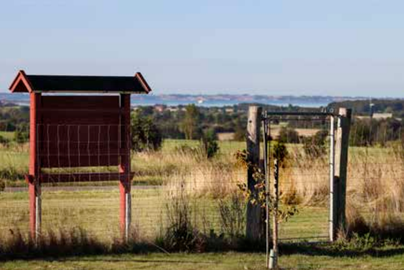
Frugthaven ligger på en fed og næringsrig lerjord med udsigt over Det Sydfynske Øhav.