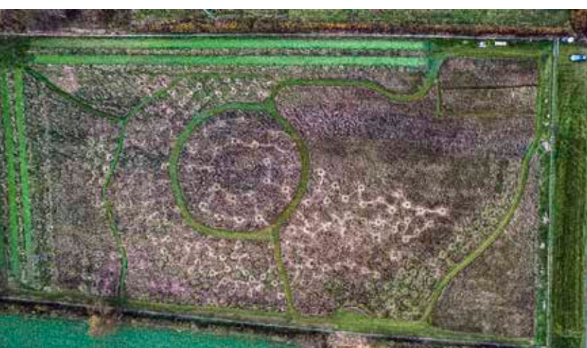
Træerne står ikke i lige rækker, da haven ikke skal ligne en produktionsplantage, men tydeligt være en besøghave, som man har lyst til at gå på opdagelse i.