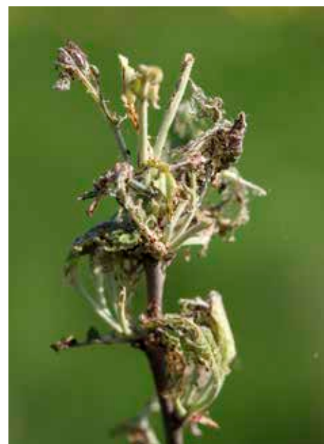
Nogle træer har været angrebet af spindemøl, som de frivillige har bekæmpet ved at fjerne angrebne skud manuelt.