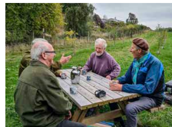
De frivillige er naturligvis interesserede i æbler og de gode historier omkring dem, men én af de ting, der også er med til at kitte gruppen tæt sammen, er pauserne, hvor kaffen og kagen kommer frem, og snakken og idéerne lystigt går på tværs af bordet.